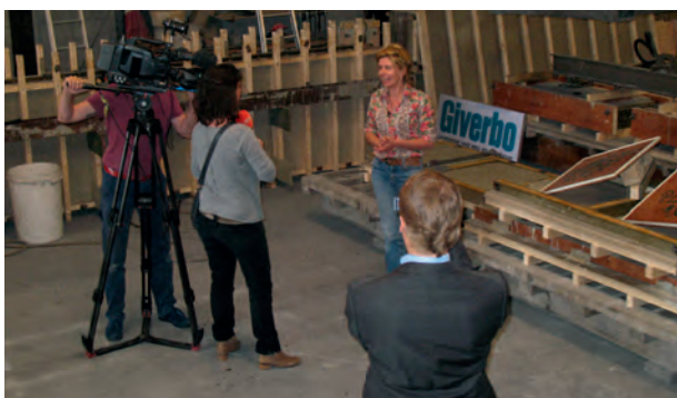
Opname SBS6 Hart van Nederland